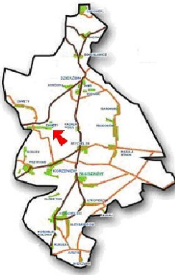
Rysunek 2.1. Położenie miejscowości Zamęty

Miejscowość Zamęty zlokalizowana jest na granicy województwa wielkopolskiego, w jego południowo-wschodniej części, administracyjnie należy do gminy Mycielin w powiecie kaliskim. Zamęty położone są na północ od Kalisza, tuż za miejscowością Korzeniew. Do Urzędu Gminy, położonego w miejscowości Słuszków, z Zamęt jest około 8 km. Położenie miejscowości Zamęty w Gminie przedstawia Rysunek 2.1.